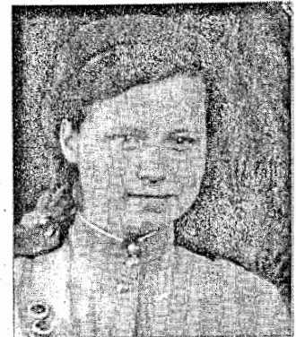
День Победы встретила в Польше...

Лобанова, Н. «Войну вспоминаю с болью...» / Н. Лобанова // Искра. – 2004. – 10 февр. – С. 3.