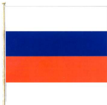
Государственный флаг Российской Федерации

Совет Федерации и Государственная Дума занимаются важными государственными делами, но главной их задачей является принятие законов . Как это происходит? Вначале проект закона принимается на заседании Государственной Думы: депутаты собираются вместе, обсуждают проект нового закона , вносят в него дополнения, изменения, потом голосуют. Если большинство проголосовало за новый закон, то он принимается. Далее закон передаётся на рассмотрение Совету Федерации. Если больше половины членов этой палаты проголосуют за него, то он считается одобренным и передаётся на подпись Президенту . Глава государства должен подписать закон или наложить на него запрет – вето . В случае подписания Президентом новый закон становится обязательным для всех.