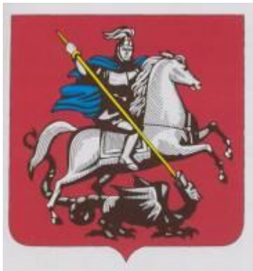
Герб города Москвы

Легенда гласит: в одном царстве поселился в озере огромный Змий. Каждый день жители царства должны были отдавать ему на съедение одного ребёнка. Он съел всех детей и потребовал отдать ему царскую дочь. И тут на помощь жителям явился всадник на белом коне с копьём в руках и пронзил чудище. Конь растоптал Змия. Этим всадником был святой воин Георгий Победоносец. Герб столицы – это символ победы Добра над Злом. Он используется в государственном гербе России: щит с изображением Георгия Победоносца изображён на груди двуглавого орла. В столице герб Москвы используется на зданиях городской Думы и Правительства Москвы, на печатях и бланках официальных документов, на вывесках московских школ, в залах совещаний. Флаг Москвы повторяет изображение герба: на тёмно-красном полотнище – Святой воин Георгий Победоносец, поражающий Змия.