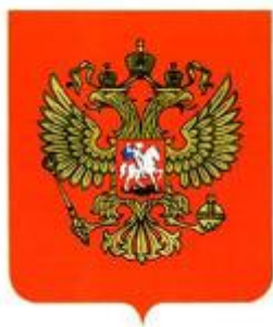
Государственный Герб Российской Федерации

называется тайным. Это делается для того, чтобы никто не смог повлиять на выбор граждан. Бюллетени с пометками избирателей опускаются в специальный ящик (урну). Затем избирательные комиссии подсчитывают результаты и определяют, кто избран Президентом или депутатом Государственной Думы. По результатам выборов формируются органы власти, которые от имени народа в течение 4 лет будут принимать законы, решения, постановления, т.е. правила, по которым будет жить страна.