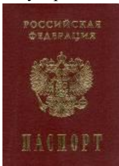
Паспорт гражданина России

Гражданин – человек, который относится к населению данного государства и по законам страны имеет права и обязанности. Гражданин должен соблюдать законы государства, а государство – обеспечивать гражданину защиту его