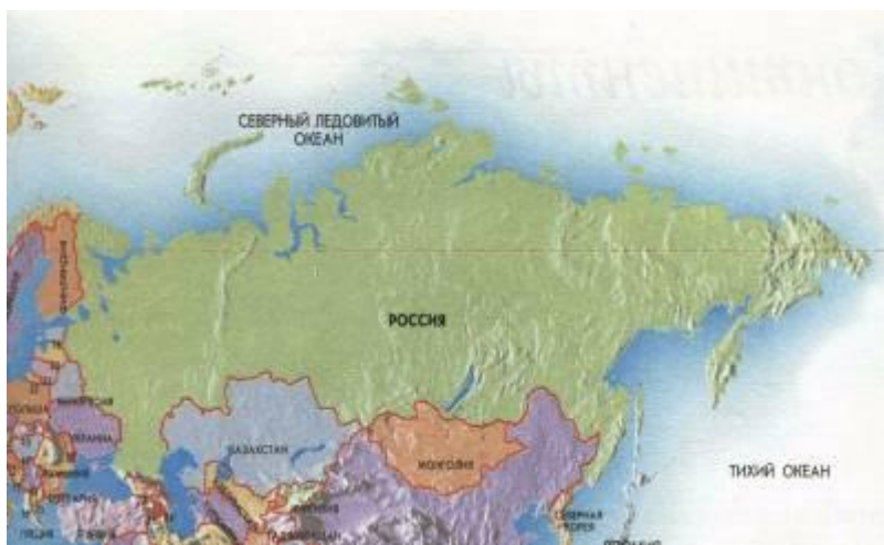
Россия на географической карте

союз, объединение. Россия объединяет в своём составе республики, края, области, автономные округа, все они называются субъектами Российской Федерации . Наша страна – многонациональная, в ней уже давно живут вместе десятки больших и малых народов. Это русские и удмурты, татары и чувашаи, буряты и калмыки, евреи и эвенки, коряки и чукчи, адыгейцы и осетины и множество других национальностей. Все живущие в России люди называются соотечественниками, россиянами . Ведь у них одна Родина, одно Отечество – Россия. Независимо от того, к какому народу принадлежит житель Российской Федерации, он является её полноправным гражданином. Россия – страна великой истории и культуры. Во всем мире известны имена русских ученых, поэтов, музыкан-