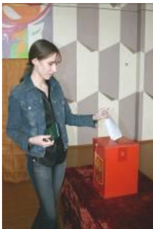
На избирательном участке

Выборы. Россия – государство с такой формой правления, когда органы власти, руководство страны избираются на определенный срок народом. Глава государства – Президент – избирается для руководства страной на 4 года. Президентом может быть избран гражданин Российской Федерации не моложе 35 лет, постоянно проживающий в России не менее 10 лет.