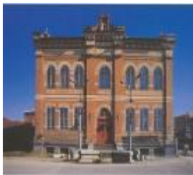
Лысьвенский драматический театр им. А.Савина

Городом Лысьва стала в 1926 году. До этого времени это был поселок, который назывался Лысьвенский завод. В годы Великой Отечественной войны именно на лысьвенском заводе выпускались солдатские каски, спасшие жизни многим бойцам. Десяти лысьвенцам – участникам Великой Отечественной войны было присвоено звание Героя Советского Союза. В послевоенные годы в городе строились новые дома, разбивались сады и скверы. Гордостью этого времени стал турбогенераторный завод, превратившийся в одно из крупнейших предприятий страны. Сейчас он называется холдинговая компания ОАО «Привод».