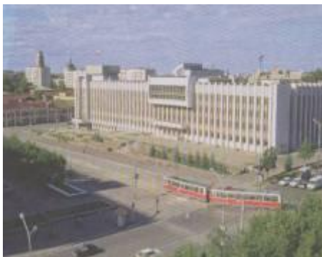
Здание Законодательного собрания Пермского края

Законодательное Собрание принимает законы, по которым живёт весь Пермский край. Принятые законы проводит в жизнь исполнительный орган власти – Правительство Пермского края . Оно состоит из министерств, агентств, инспекций и комитетов. Каждое из этих подразделений занимается решением «своих» вопросов. Министерство здравоохранения занимается организацией медицинского обслуживания на территории всего края. За образование и работу учебных учреждений отвечает министерство образования. За состоянием природы следит Государственная инспекция по охране окружающей среды и т. д. Возглавляет Правительство Пермского края – Глава Правительства . Главой всего Пермского края как субъекта Российской Федерации является Губернатор .