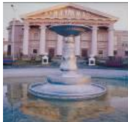
Культурно-досуговый центр лысьвенского металлургического завода

Современная Лысьва славится своей богатой культурной жизнью. В городе открыто несколько