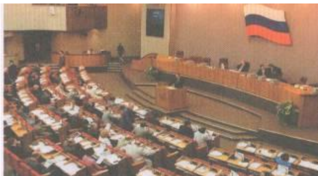
Заседание Государственной Думы

Федеральное Собрание (парламент). Законы по управлению государством принимает парламент (это слово переводится как «говорить»). В современной России парламент называется Федеральным Собранием, ему принадлежит законодательная власть в стране. Федеральное Собрание состоит из двух палат (частей) – Совета Федерации и Государственной Думы . В Совет Федерации входят по два руководителя республик, краёв, областей, и автономных округов, входящих в состав России. Государственная Дума состоит из 450 депутатов (избранных народом людей), которые избираются сроком на 4 года. Депутатом Государственной Думы может быть избран гражданин России, которому исполнился 21 год.