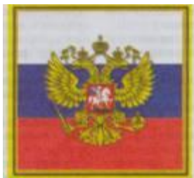
Штандарт Президента Российской Федерации

Президент России имеет свой флаг. Он называется Штандартом Президента Российской Федерации . Это флаг квадратной формы. На фоне белой, синей и красной полос в центре расположен герб России. Края штандарта украшает золотая бахрома.