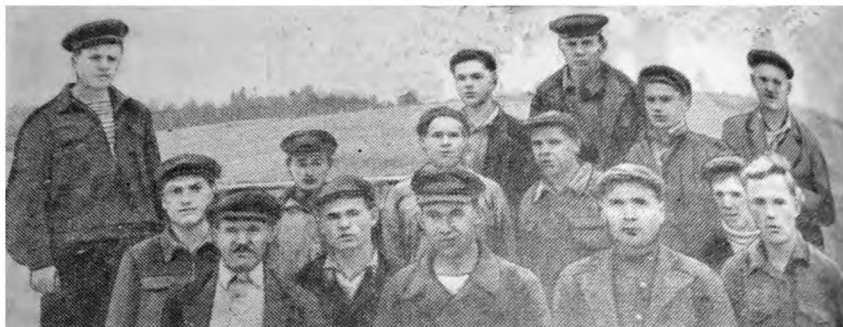
Бригада шефов из лудильного цеха ЛМЗ на строительстве овощехранилища в колхозе «Заря»

размере 100 руб. в год. В качестве источника финансовых ресурсов на разгром немецко-фашистских захватчиков 29 декабря 1941 года ВС СССР принял Указ «О военном налоге».