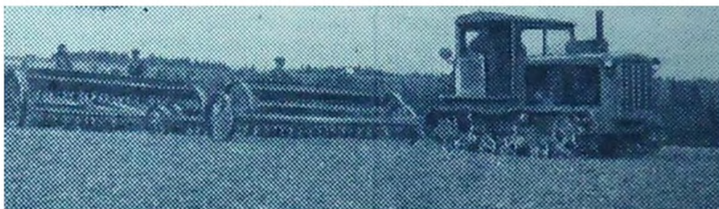
Сев ржи в колхозе «Колос»

Под предлогом борьбы со спекулянтами и перекупщиками горисполком принял решение о продаже колхозниками сельхозпродукции со своих подворий только в специальных ларьках колхозного рынка. Продажа в других местах запрещалась под страхом привлечения к уголовной ответственности.